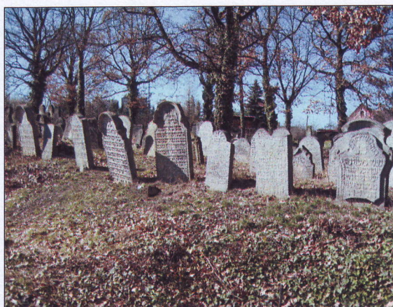
Der Jüdische Friedhof Teplice-Sobedruhy

Da dieser Friedhof von keiner schützenden Begrenzung umgeben ist, ist er dem Diebstahl, dem Vandalismus und der Zerstörung völlig frei ausgesetzt. Die kleine Jüdische Gemeinde Teplice verfügt jedoch über keine finanziellen Mittel, um die Kosten für die dringend erforderliche Einfriedung des Friedhofes in Höhe von ca. 150.000 Euro aufzubringen.